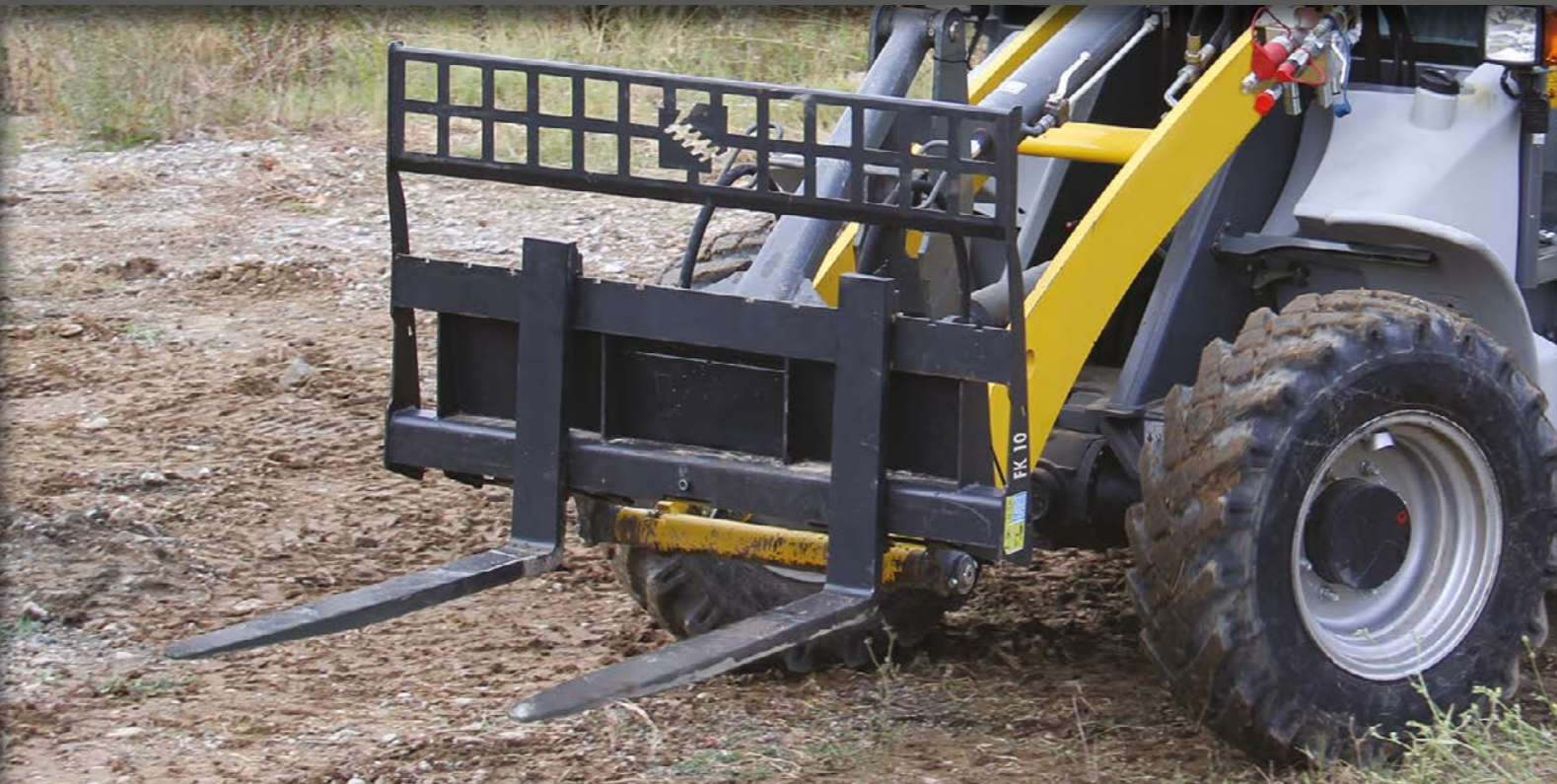
PALETTENGABEL ZUM ANBAU AN SKIDLOADER, RAD-, TELESKOP- UND BAGGERLADER. EIN KLAPPBARES SCHUTZGITTER SICHERT DIE LADUNG WÄHREND DER FAHRT.