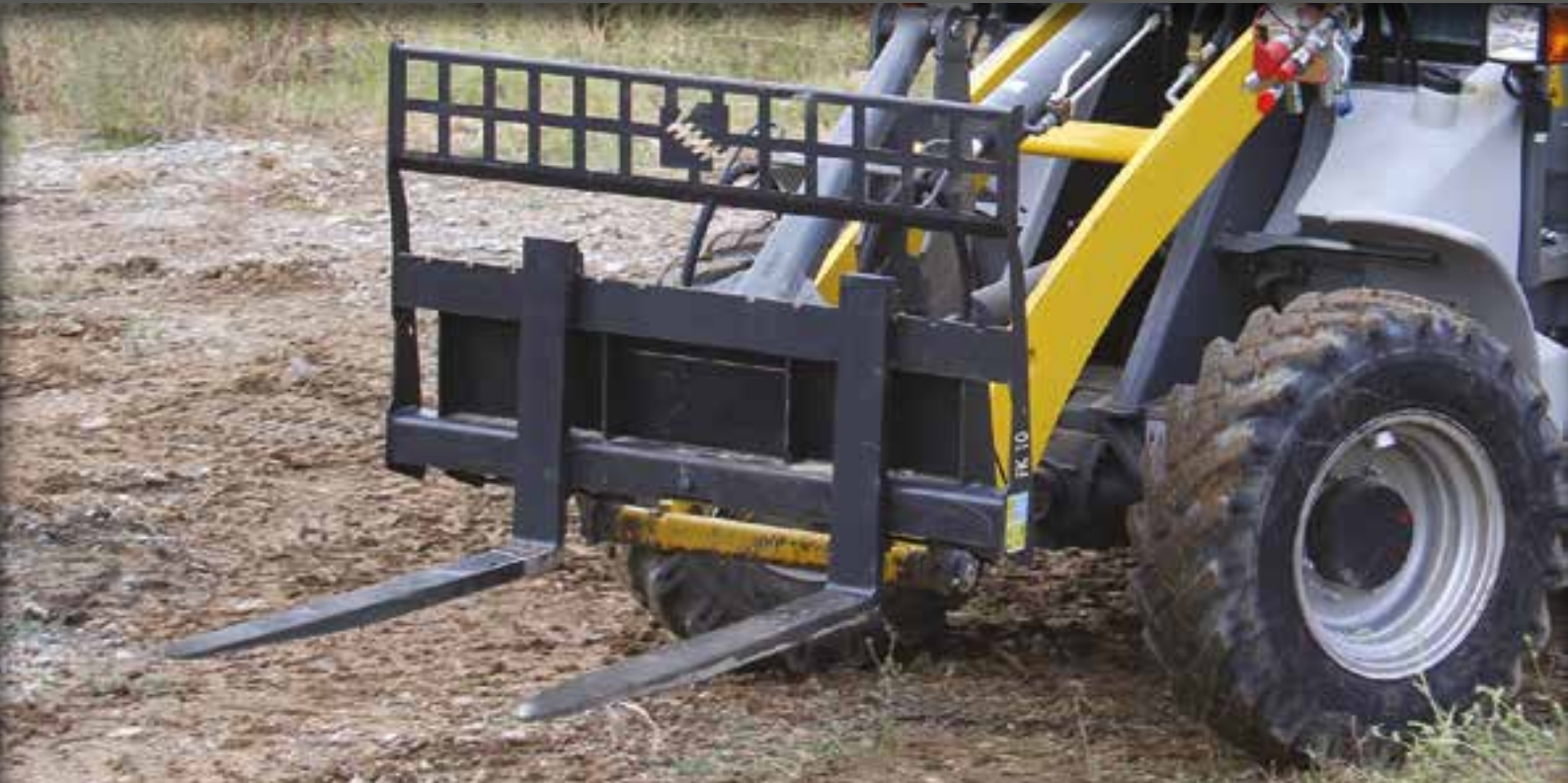
HORCA DE PALETAS COMPATIBLE CON MINICARGADORAS, PALAS SOBRE RUEDAS, CARGADORAS TELESCÓPICAS Y RETROCARGADORAS. DOTADA DE UNA PROTECCIÓN DE SEGURIDAD CONTRA EL VUELCO DE LA CARGA DURANTE EL USO.