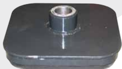
DETTAGLIO - DETAIL - DÉTAIL - DETAIL

VENTOSA RETTANGOLARE COMPLETA DI GUARNIZIONE RECTANGULAR SUCKER WITH GASKET VENTOUSE RECTANGULAIRE AVEC JOINTS VIERECKIGE SAUGPLATTE MIT DICHTUNG